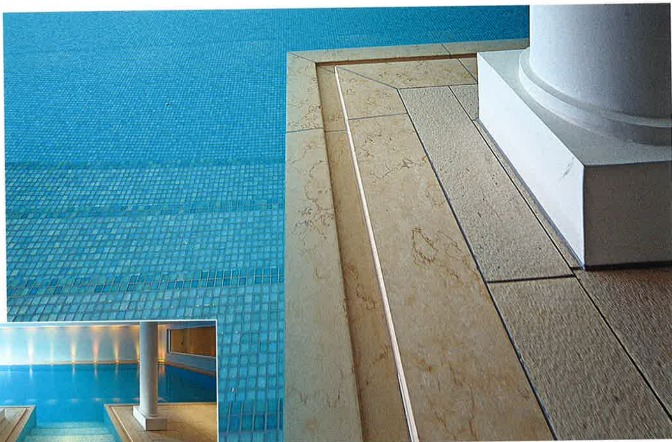
Das Schwimmbecken wurde mit einer STEULER-Q 2 -Abdichtung versehen und dann mit Mosaikfliesen ausgekleidet. Dabei ist die Überlaufrinne eine Eigenkonstruktion und wurde speziell für dieses Projekt angefertigt.