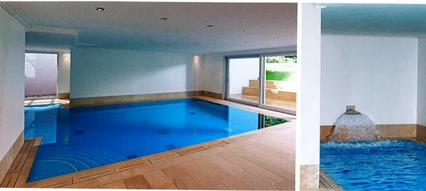
Kunstvoll wurde das Schwimmbecken in die Nische platziert. Von zwei Seiten fällt Tageslicht auf die Wasseroberfläche und lässt das Beckenwasser attraktiv schimmern. Gleichzeitig ist der Pool mit zahlreichen Wasserattraktionen wie z.B. einer Schwalldusche ausgestattet. Auch die Rinne ist eine speziell angefertigte Konstruktion.

Um für den Bauherrn eine möglichst lange Schwimmbahn in dem relativ kleinen Raum zu gewährleisten, wurde das Schwimmbecken ergonomisch in die vorhandene Nische eingebaut.