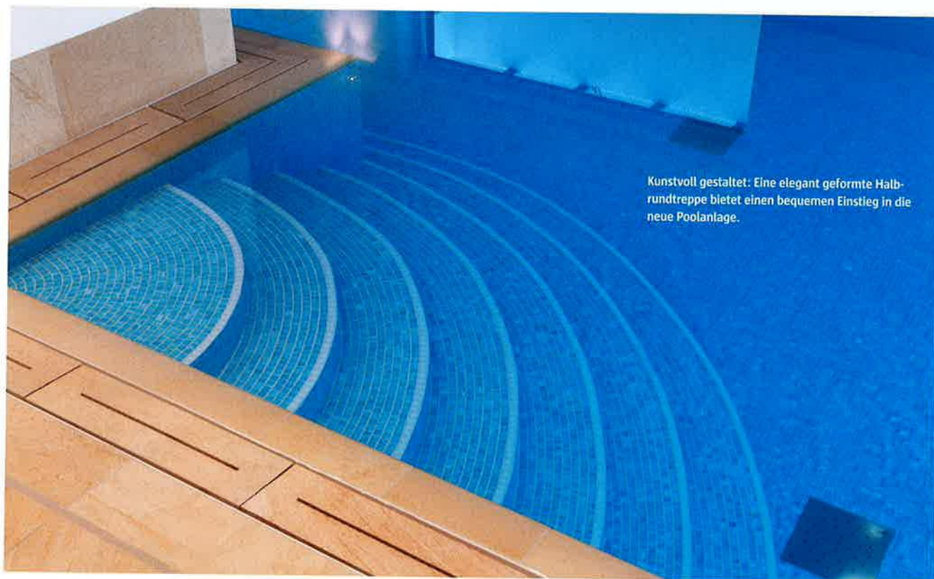
Kunstvoll gestaltet: Eine elegant geformte Halbrundtreppe bietet einen bequemen Einstieg in die neue Poolanlage.

Um für den Bauherrn eine möglichst lange Schwimmbahn in dem relativ kleinen Raum zu gewährleisten, wurde das Schwimmbecken ergonomisch in die vorhandene Nische eingebaut.