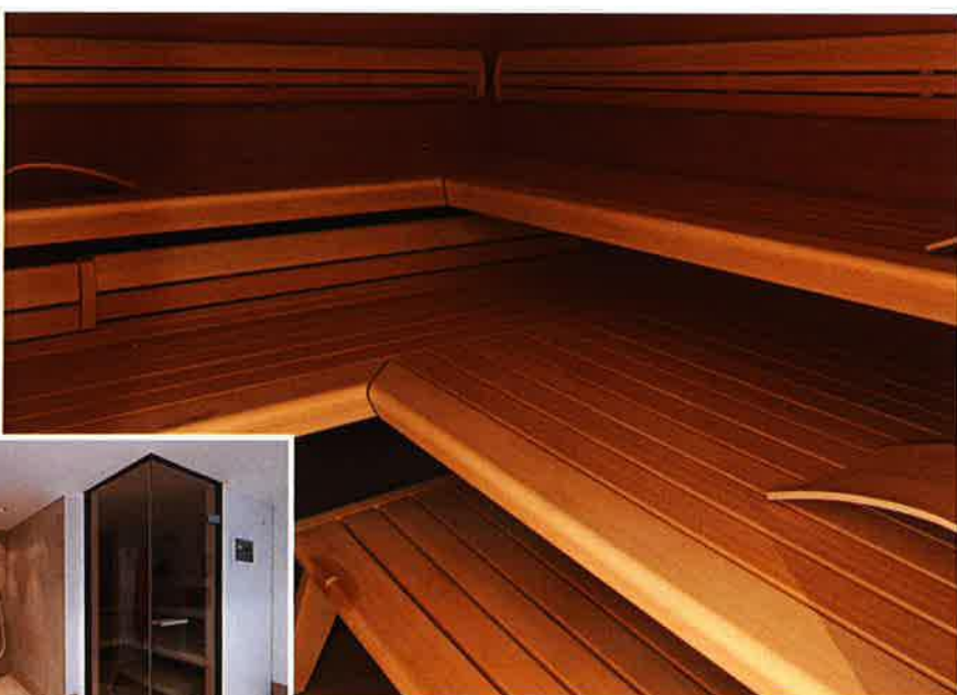
Neben dem Schwimmbecken war noch genügend Platz, um eine Sauna mit bodentiefen Glasscheiben über Eck und eine Dusche zu integrieren.

Rollladen-Abdeckung: MKT Wolfgang Tödt GmbH 51427 Bergisch Gladbach Tel.: 02204/66277 mail@mkt-web.de, www.mkt-web.de