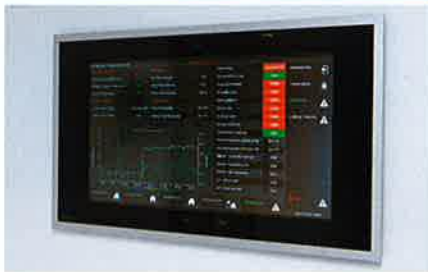
Eine Rollladen-Abdeckung deckt das Becken trotz der eigenwilligen Form komplett ab. Umfangreich ist der Pool mit Wasserattraktionen ausgestattet wie z.B. mit einem Bodengeysir und vor allem mit zwei Sprudelliegen unter dem Fenster. Am Display der Steuerung lassen sich alle Werte leicht ablesen und korrigieren.