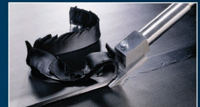
Mit dem Blick für das Ganze aber auch mit dem Blick für die besonderen Details - perfekte Ausführung mit der Nachbearbeitung der Nahtstellen.