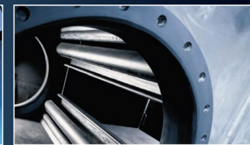
Flächen, Stutzen, Einbauten – in allen Details werden verfahrenstechnische Bauteile wirksam geschützt.