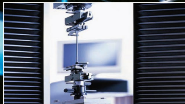
Von der Entwicklung der Werkstoffe über eigene Produktion bis hin zur treffsicheren Auswahl durch die anwendungstechnische Beratung – Steuler hat für jede Anforderung die optimale Gummierungstechnologie.