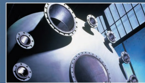
Werkstoffhomogene Auskleidungstechnologie: Komplett gummierter Prozessapparat.